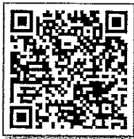
บัญชีรายชื่อ_รุ่นที่ ๑

กระบี่, กาฬสินธุ์, กำแพงเพชร, ชัยนาท, นครพนม, น่าน, บึงกาฬ, บุรีรัมย์, พังงา, ภูเก็ต, มุกดาหาร, สกลนคร