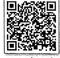
บัญชีรายชื่อ_รุ่นที่ ๖

ฉะเชิงเทรา, ชลบุรี, ชุมพร, ตรัง, ตรวาท, นครนายก, นนทบุรี, ประจวบคีรีขันธ์, ปราจีนบุรี, พิจิตร