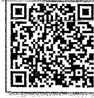
บัญชีรายชื่อ_รุ่นที่ ๕

กาญจนบุรี, ขอนแก่น, เชียงราย, สุรินทร์, อุทัยธานี